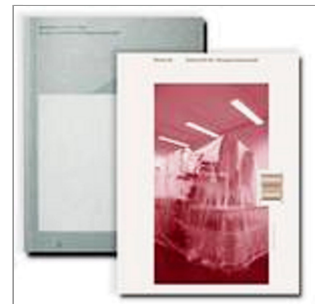
Neuwerk, Zeitschrift für Designwissenschaft; die vierte Ausgabe „Stille“ der gegenwärtigen HerausgeberInnen ist vor wenigen Tagen bei form+zweck erschienen: www.neuwerk-magazin.com