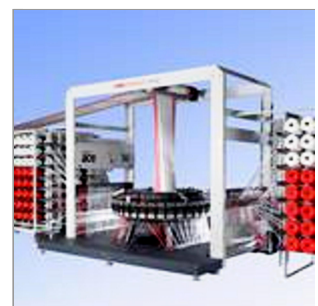
Neugestaltung einer Maschine: die ace 6 von Lohia Corp