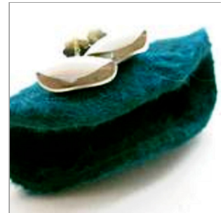
Ohrschmuck Schote mit formwiederholendem Behältnis; Sterlingsilber, Zuchtperle naturfarben, Haarfilz Melousine