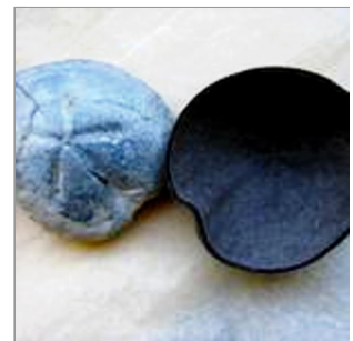
Schale Cardiotaxis; Haarfilz und zugehörige Model, eine Versteinerung aus der Urzeit