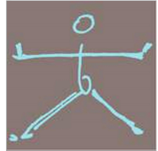
Imagekampagne für Yoga: >>Yoga schafft Raum<<

Ich wünsche mir Beständigkeit. Das, was ein Produkt ausmacht, muss für eine lange Zeit gültig bleiben. Eine wichtige Qualität ist deshalb ein guter Alterungs-Prozess der verwendeten Materialien. Das führt mich oft zu Holz, Metall, Stein und Leder. Wenn ich aber über Qualität im Design spreche, meine ich auch die Qualität, die der Arbeitsprozess für mich hat und für meine Umgebung. Ich schaue heute nicht mehr so sehr auf das Produkt, das am Ende vielleicht glänzt, sondern ich achte darauf, wie ich mit wem unter welchen Umständen an dieses Ziel komme. Zum Beispiel musste es möglich sein, so lange die Kinder klein waren, die Waschmaschine und den Mac gleichzeitig im Blick zu haben. Das ging, weil ich mein Büro zu Hause hatte. Ein eher einsamer Job auf die Länge. Aber der Haushalt lief so mit. Heute darf ich mich mit meinen selbst gewählten, schlaun Kolleginnen beraten, wenn ich bei einer Arbeit stecken bleibe. Das ist eine luxuriöse Lebenslage und Qualität in meinen Augen.