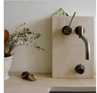
Spüle aus Lens-Sandstein

Der Austausch in einer Gruppe. In Zusammenarbeit mit meiner langjährigen Yogagruppe entstand die Idee für eine Image-Kampagne für Yoga. Wir fanden das Reden über Yoga immer sehr schwer und wollten es von seiner „Heiligkeit“ befreien. Es entstand eine Art Spielkarten-Set mit je einem Asana auf einer Karte und einem leicht verständlichen Text: Yoga beflügelt. Yoga beruhigt. Yoga erleuchtet. Yoga macht schlank... als ironische Antwort auf die ewige Frage: Wozu ist diese Übung gut?